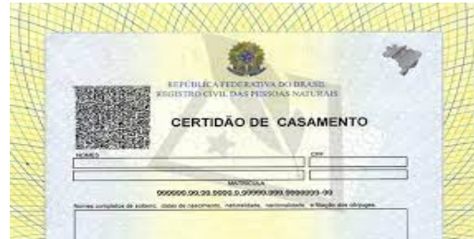
Casamento quando casado, separado, divorciado ou viúvo.