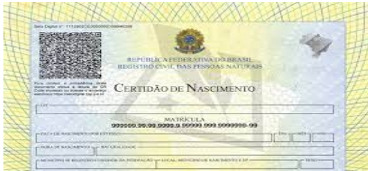
Nascimento quando solteiro.

Certidão de estado civil emitida nos últimos 06 (seis) meses; ATUALIZADA.